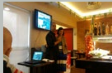
Jantar dos Namorados