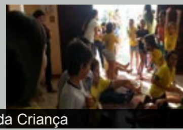
Semana da Criança