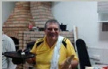
Encontro de Casais