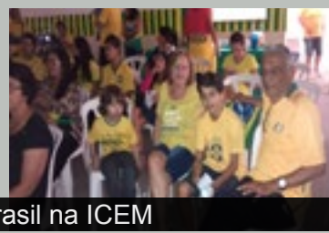
Jogos do Brasil na ICEM